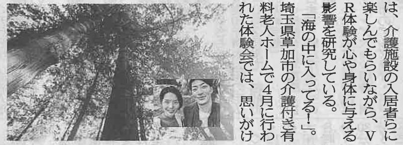
「ANA VIRTUAL TRIP」で専用ゴーグルを見た際のイメージ。右下の枠にビデオ通話の様子が映し出され会話ができる

「海の中に入っている」。は、介護施設の入居者らに楽しんでもらいながら、VR体験が心や身体に与える影響を研究している。